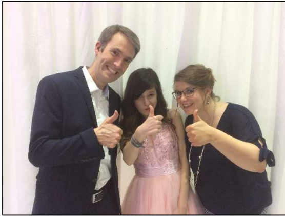
Auf dem Abiball: Das Tutorenteam ist sehr stolz auf ihre erste gehörlose Abiturientin.

Durch eine erfolgreiche Teamarbeit , eine große Methodenvielfalt , den Einsatz eines Tablets mit Spracherkennung und die regelmäßige Fortbildung aller LehrerInnen gelang es, dass die hörenden, schwerhörigen und gehörlosen SchülerInnen in Kontakt kamen, dem Unterricht gut folgen und miteinander auf vielfältige Weise kommunizieren konnten. Auch der freiwillige Besuch eines DGS-Kurses stand allen LehrerInnen und SchülerInnen offen.