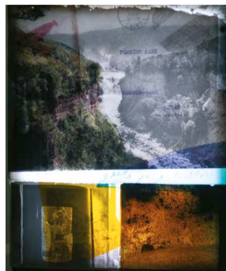
Dana Flora Levy Lightbox Collages, 2025