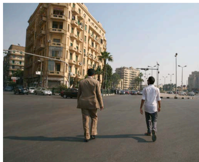
Tamir Zadok The Man in the Suit, 2017